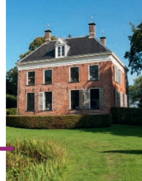
Bad Nieuweschans, op de Nederlands-Duitse grens, vormt in zijn geheel een beschermd dorpsgezicht. Je komt hier langs als je vanaf de Dollard naar Winschoten vaart.

armoede heerste – een voedingsbodem voor het communisme dat hier hardnekkig is aangehangen. Nog steeds heeft de communistische partij trouwens zetels in de raad.”